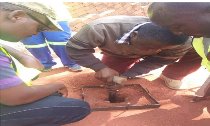
SAMPULI YA UDONGO IKICHUKULIWA KWA AJILI YA KUPELEKWA MAABARA