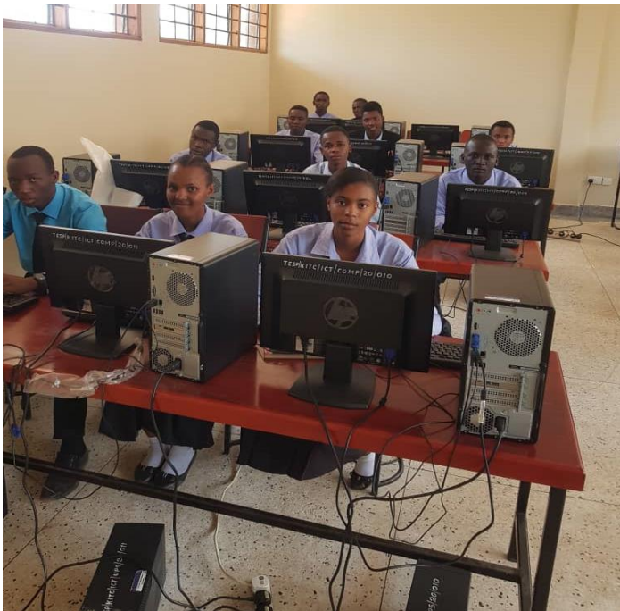
WANAFUNZI WA CHUO CHA UALIMU KITANGALI WAKIPATIWA MAFUNZO YA TEHAMA.