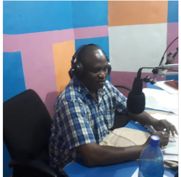
KAMANDA WA POLISI AKITOA MAFUNZO JUU YA SHERIA ZA MITANDAO