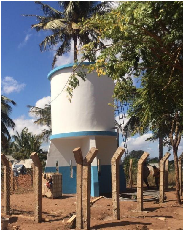
TANKI LA JUU LA MAJI