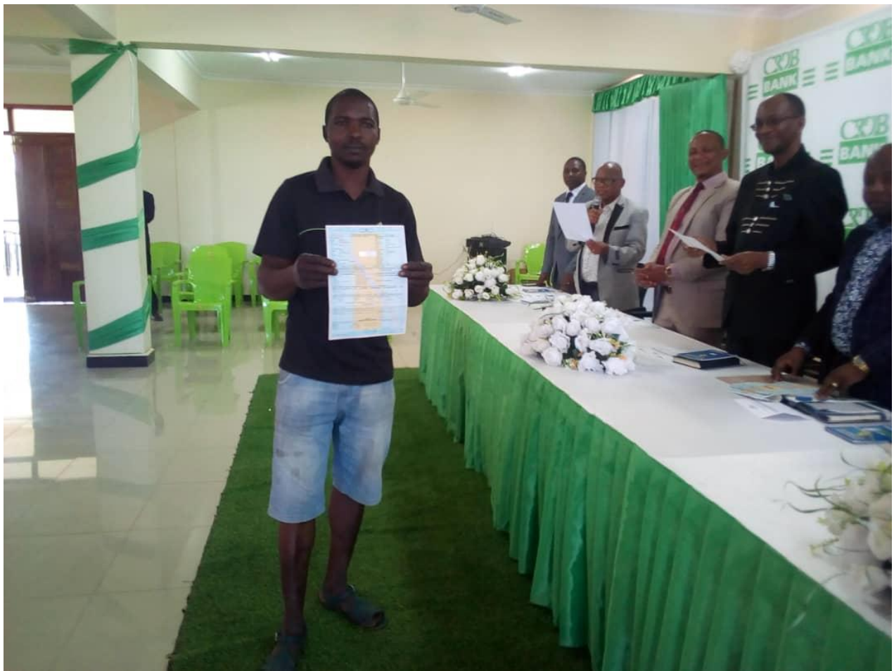
KIJANA WA BODABODA AKIONYESHA KADI YA PIKIPIKI BAADA WA KUKABIDHIWA NA MKUU WA WILAYA