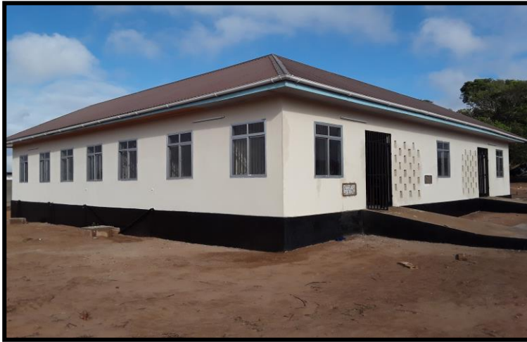
HALI YA MRADI WA ZAHANATI MWAKA 2019