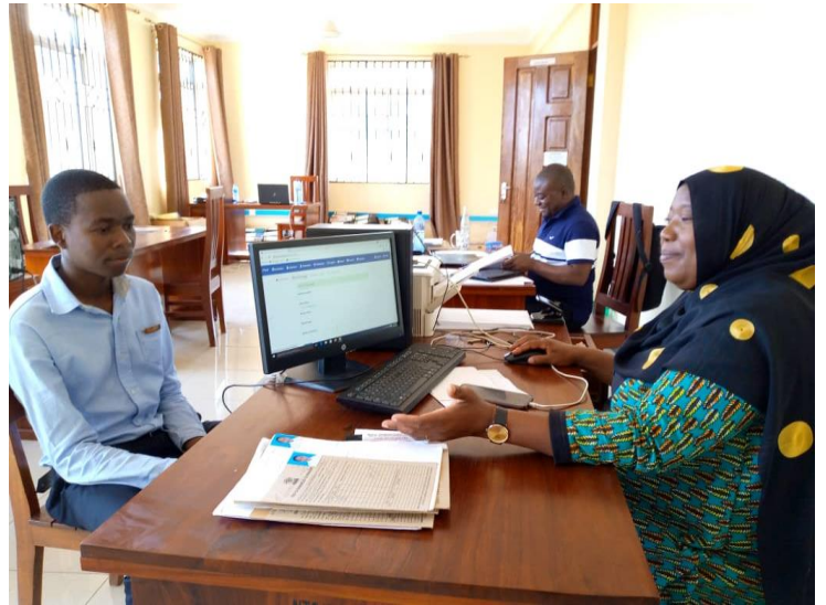
AFISA ELIMU AKIMUHAMISHA MWANAFUNZI KATIKA MFUMO