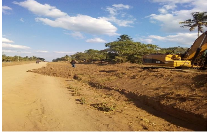
UJENZI WA BARABARA YA KIDUNI MAKONDEKO UKIWA KATIKA HATUA YA AWALI