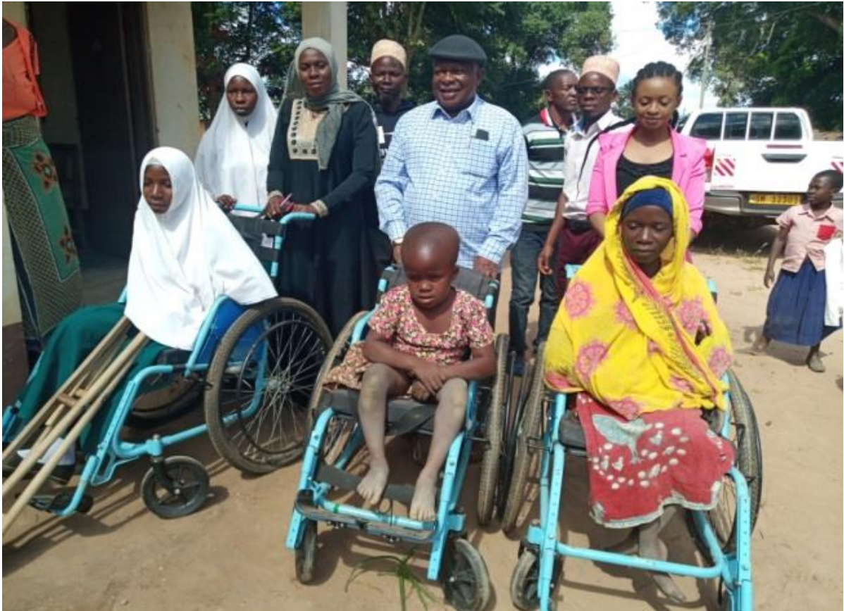
MHE. GEORGE H. MKUCHIKA MBUNGE WA JIMBO LA NEWALA MJI AKIKABIDHI BAIKLEI ZA WALEMAVU