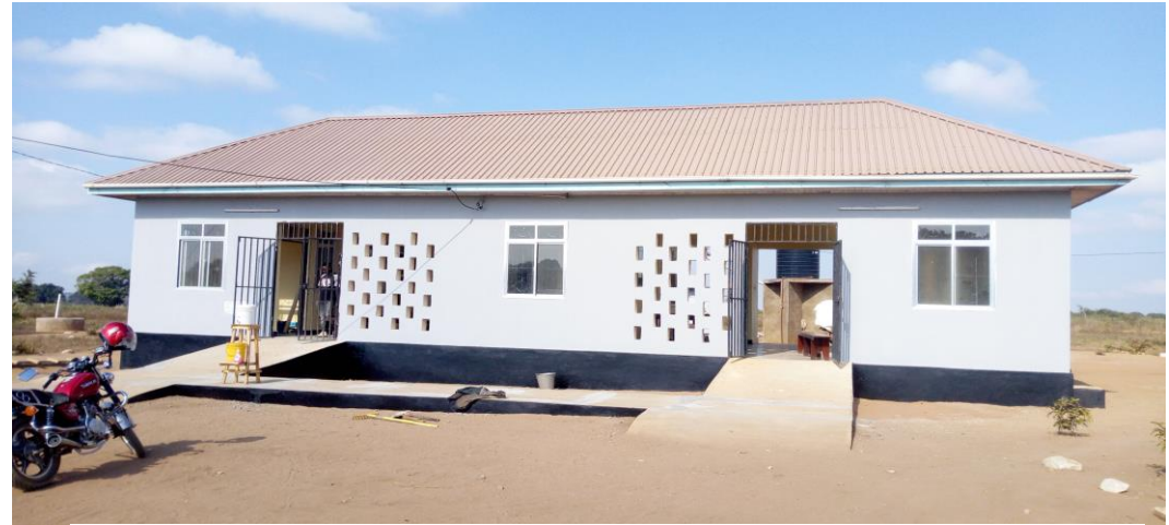
HALI YA SASA YA ZAHANATI MWAKA 2021