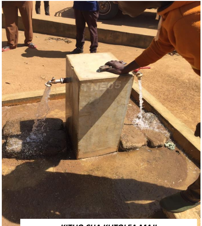
KITUO CHA KUTOLEA MAJI