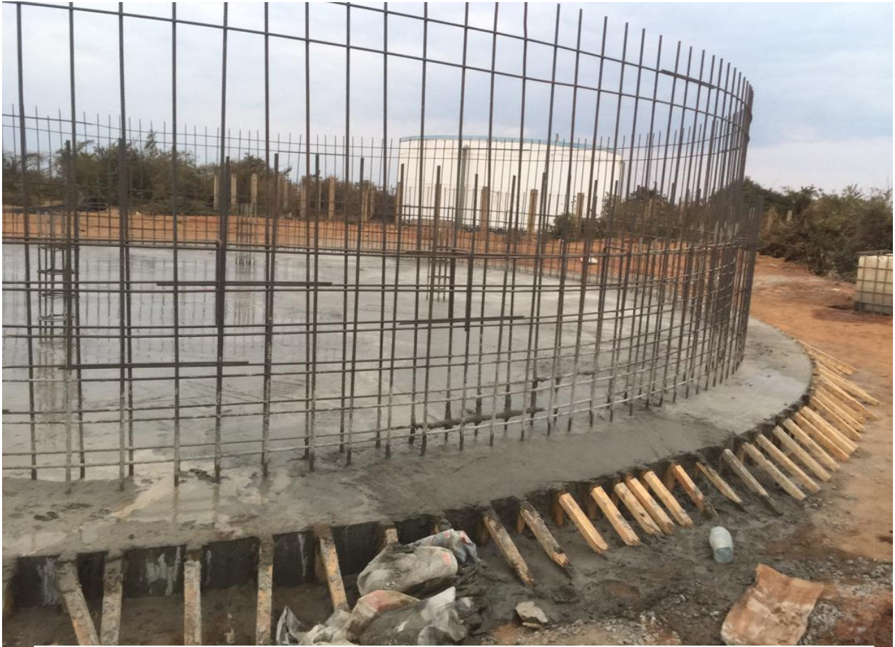
UJEZNI WA TANKI LA LITA 500,000