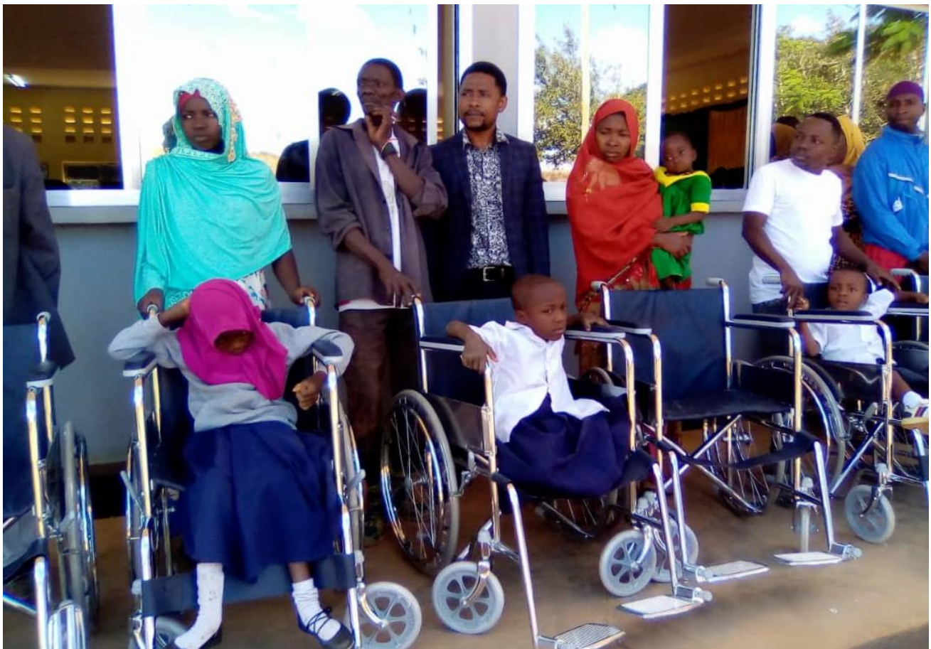
WANAFUNZI WAKIKABIDHIWA BAIKELI ZA WALEMAVU