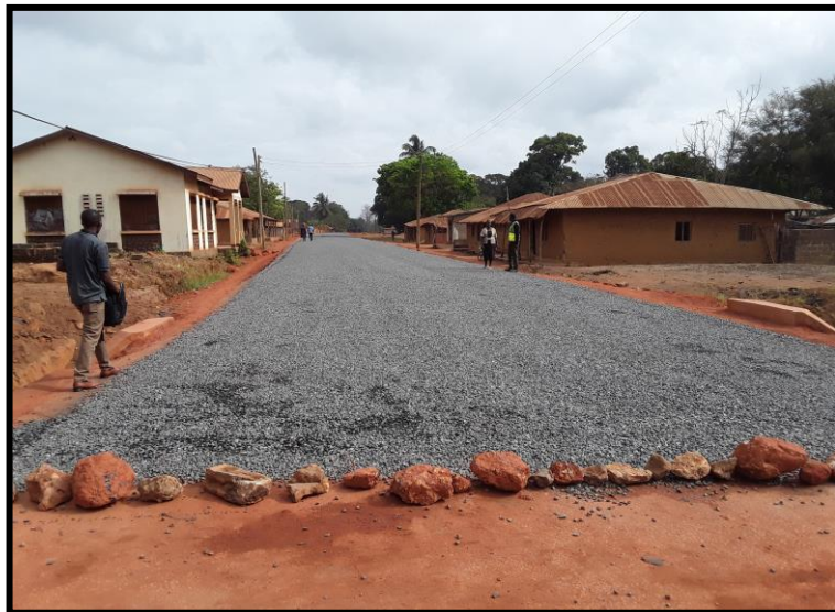
MRADI WA BARABARA YA ELIMU MWAKA 2019