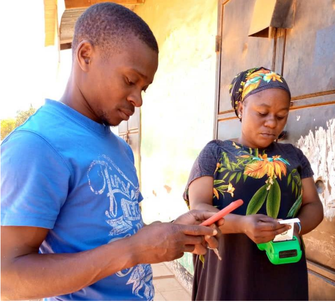
MKUSANYA MAPATO STENDI YA MABASI AKITUMIA POS