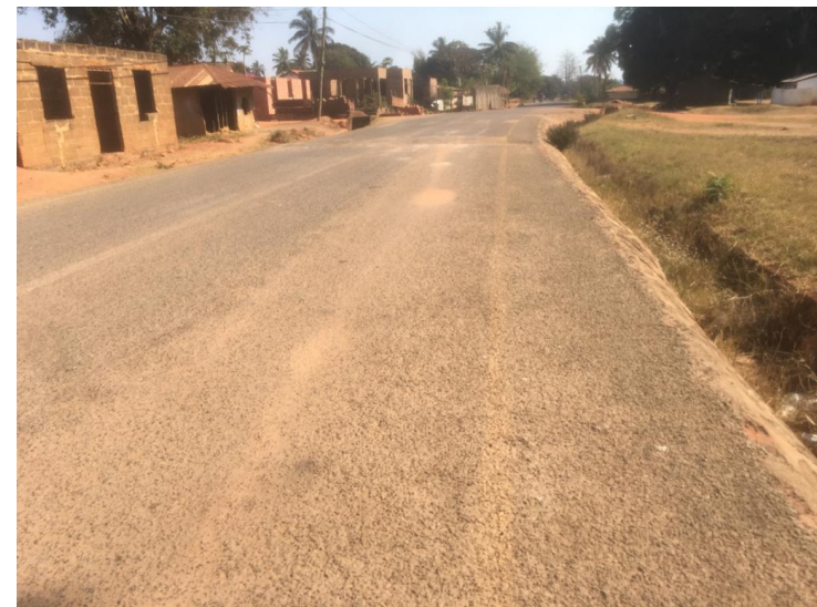
BARABARA YA ELIMU INATUMIKA