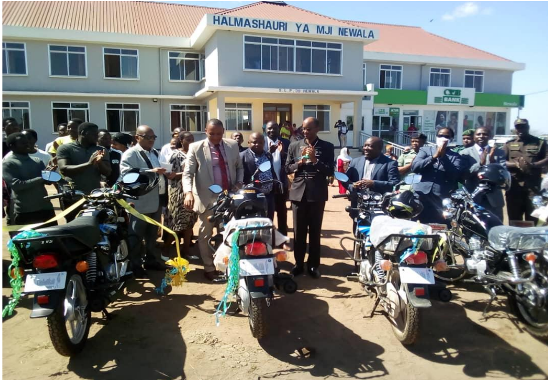
MKUU WA WILAYA AKIKABIDHI PIKIPIKI