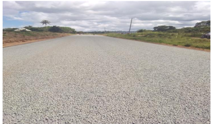
UTEKELEZAJI WA BARABARA YA KIDUNI-MAKONDEKO UNAENDELEA